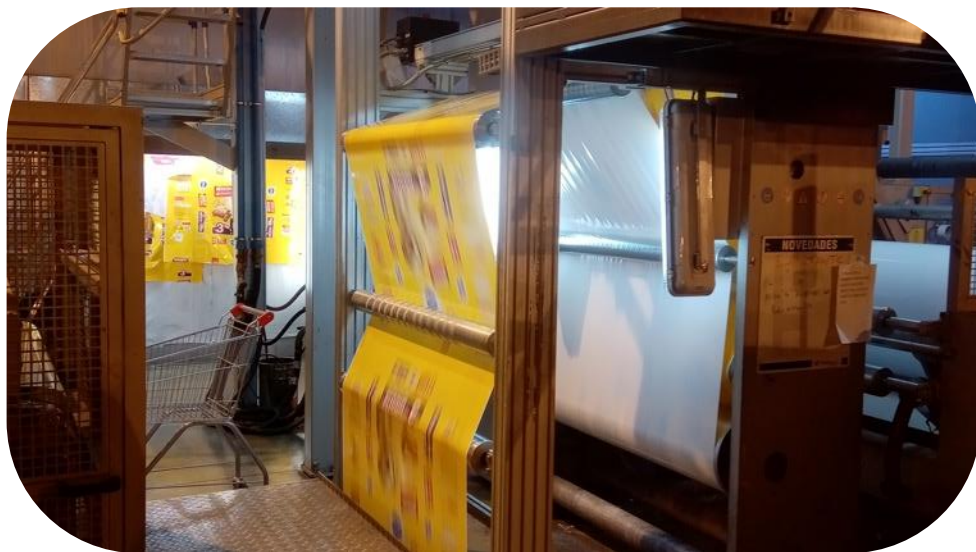
Petropack imprime ahora con 5, 6 o 7 colores especiales en la misma obra

En Argentina ya son líderes del mercado, pero ahora con una consistencia en la calidad como estrategia, –apoyada por Siegwerk PMC–, están en condiciones de enfrentarse a la competencia en los países vecinos. Y, desde luego, no tienen intención de conformarse con la impresión ECG de 7 colores.