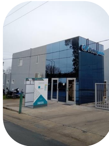
Petropack planea seguir desarrollando los mercados de exportación

flexográfica de Paraná. Algo que contribuirá, a su vez, a producir productos de embalaje más sustentables y a una economía circular respetuosa con el medio ambiente, alcanzando así uno de los objetivos estratégicos de los propietarios de la compañía.